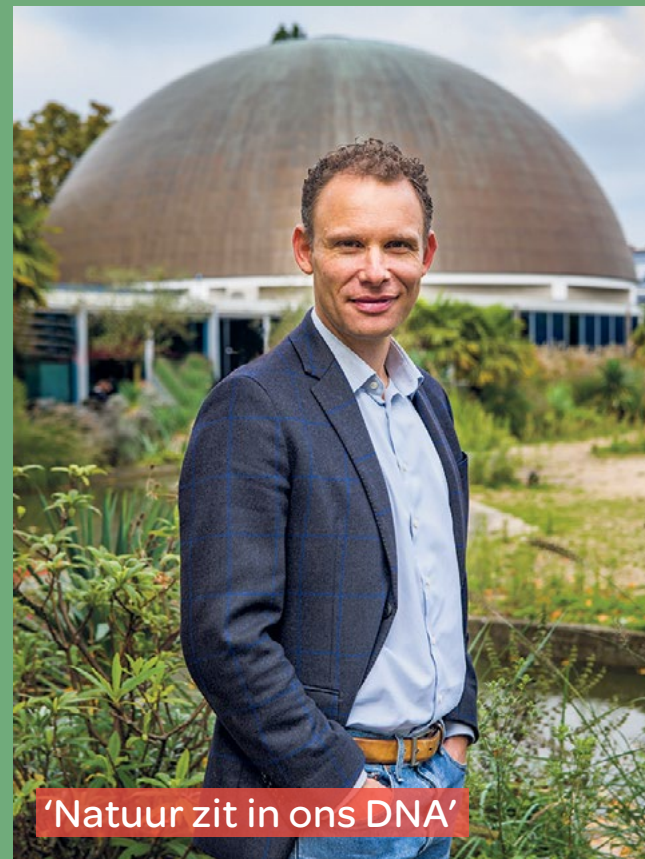
'Natuur zit in ons DNA'